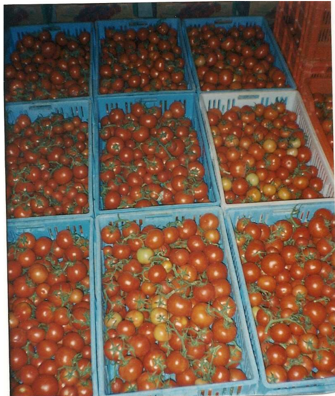
Fotografía 8 Tomates obtenidos en el invernadero