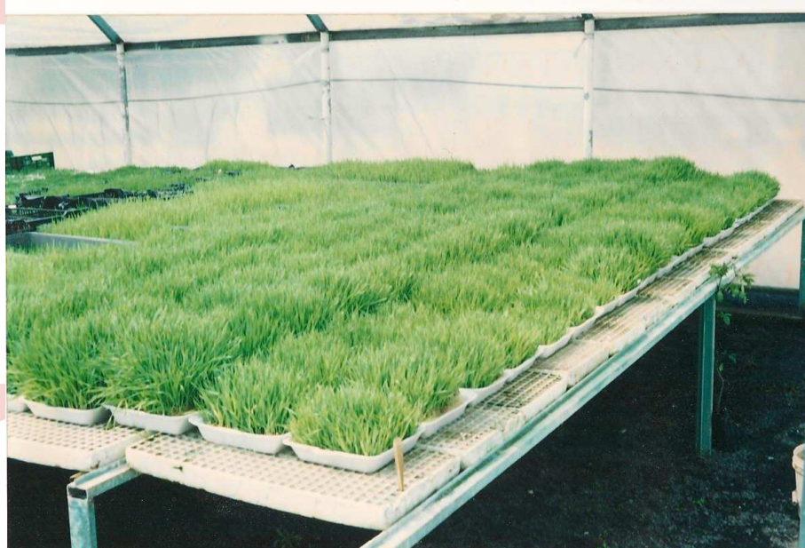
Fotografía 3 Cultivos germinados en invernadero del Kibbutz