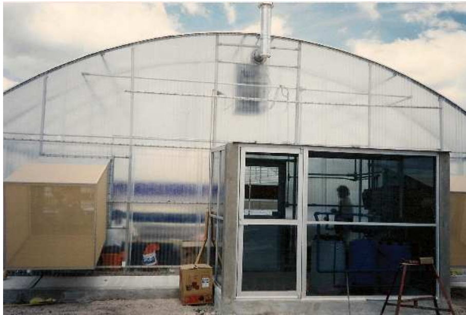
Fotografía 2 Invernadero completado.