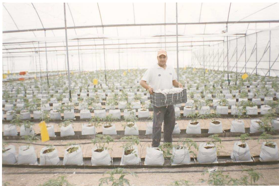
Fotografía 6 Becario del Kibbutz trabajando en uno de los invernaderos