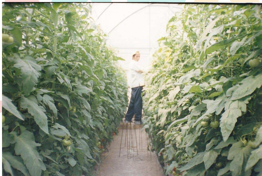
Fotografía 7 Estudiante trabajando en las plantas de tomate del invernadero.