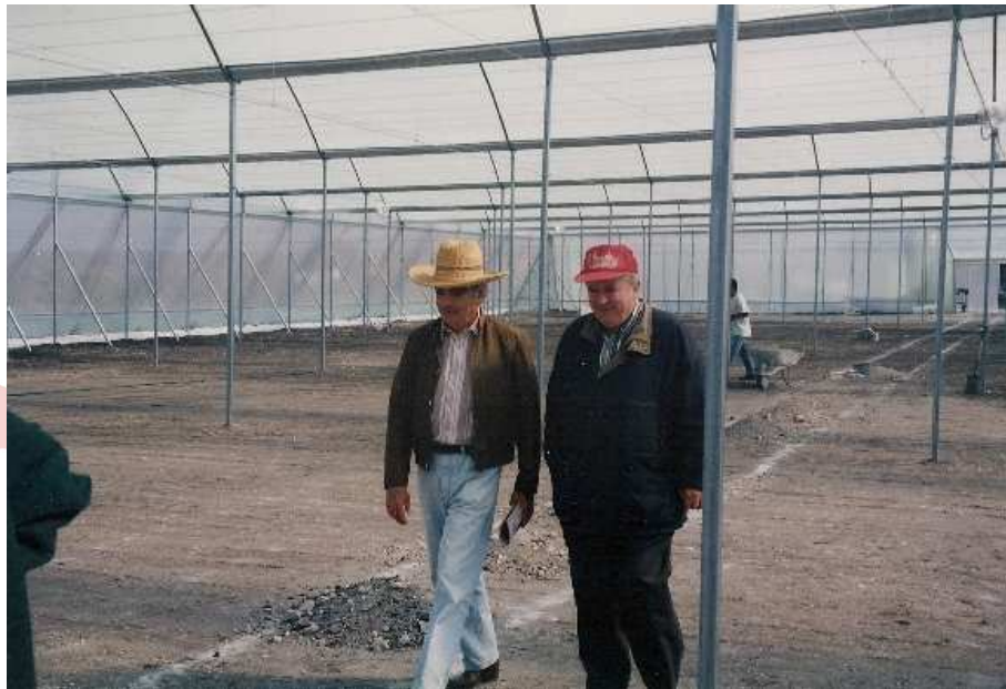
Fotografía 1 Técnicos supervisando la construcción del invernadero

A continuación se muestran fotografías de este proceso.