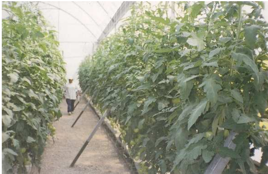
Fotografía 4 Plantación de tomates en el invernadero construido