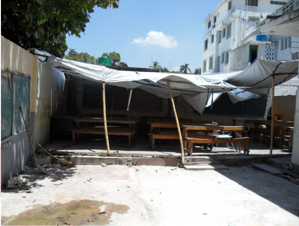
Foto 5 y 6.- (Espacio situado detrás ya la izquierda del edificio, cubierto con un plástico duro para reducir el resplandor del sol durante las sesiones. Imagínesse cómo los estudiantes son cuando llueve).