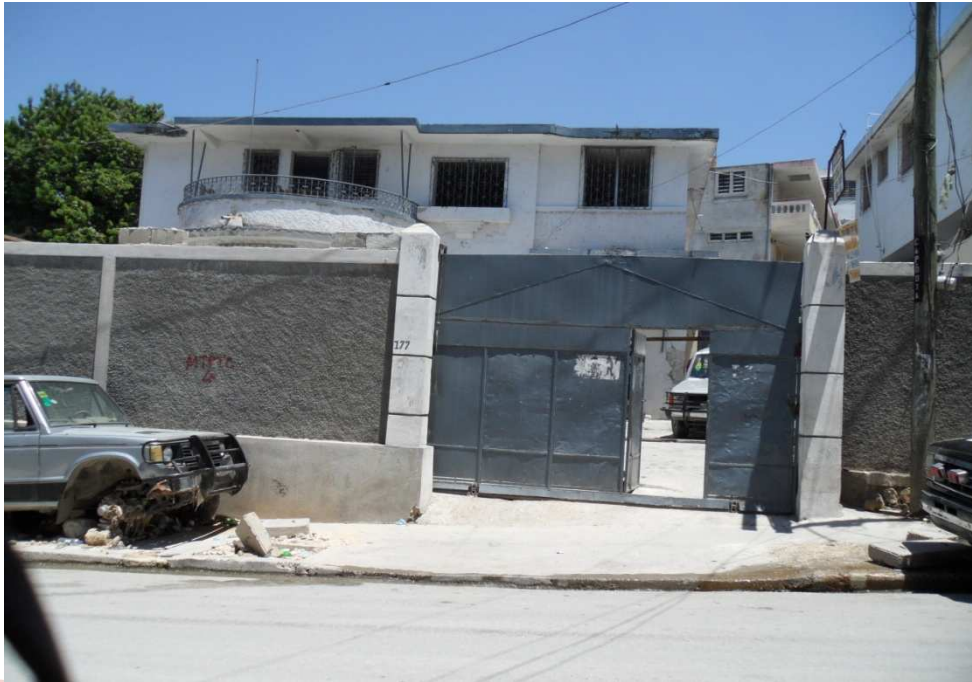
Foto 2.- (El jardín del frente de la universidad con la estructura del espacio que queda para los cursos después del terremoto).