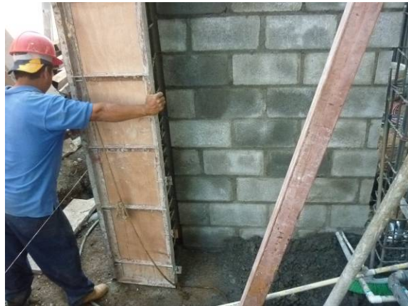
formaleteo de columnas con encofrado