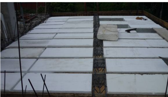
Entrepiso de bloques