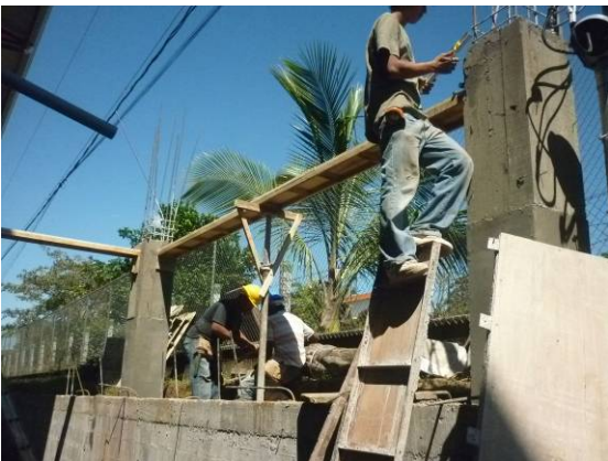
Armado de cargadores

Se levantan los muros de cortante en block y una vez armadas las columnas y encofradas, se chorrean con concreto 210 kg/cm 2 debidamente vibrado y se procede a colocarla formaleta y armadura de vigas de soporte para el entrepiso. Esta actividad se realiza con cuidado de linear bien el encofrado y soportando lateralmente para evitar abombamientos por el vibrado mecánico.