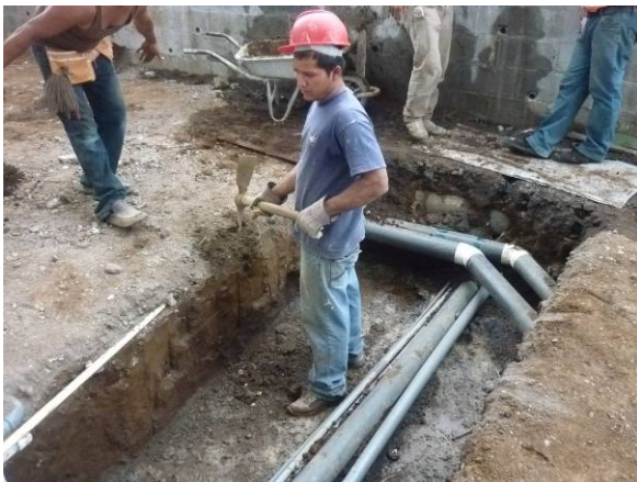
Excavación de zanjas

El proyecto se ubica en el segundo piso del proyecto en el ala norte, e inicia cuando ya están adelantadas las bases y el entrepiso correspondiente (salvo el área de la sala de procedimientos), además de las modificaciones hechas al sistema hidráulico y de disposición de aguas negras. Inicia entonces el día 17 de diciembre, con la preparación de la armadura y excavación de las placas de fundación para la sala de procedimientos. Durante las excavaciones se reviso la capacidad soportante del suelo de acuerdo al resto de las estructuras del proyecto. Además se realizaron pruebas para el concreto de dichas bases y se rectificó el diseño de la mezcla. Posteriormente se chorrean las bases, y se preparan las armaduras de columnas vigas de soporte y entrepiso de esta sala. Las armaduras se disponen de acuerdo al criterio ingenieril y el diseño original. Se exige al contratista el cumplimiento de la distribución de aros y el adecuado alineamiento de la armadura en el encofrado.