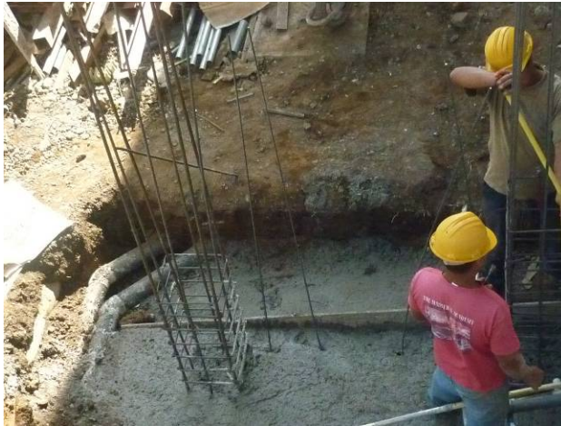
chorrea de cimientos

Se levantan los muros de cortante en block y una vez armadas las columnas y encofradas, se chorrean con concreto 210 kg/cm 2 debidamente vibrado y se procede a colocarla formaleta y armadura de vigas de soporte para el entrepiso. Esta actividad se realiza con cuidado de linear bien el encofrado y soportando lateralmente para evitar abombamientos por el vibrado mecánico.