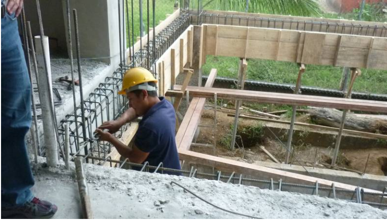
Vigas de soporte de entrepiso

Una vez soportada la formaleta de las vigas, se procede a armar el entrepiso metálico y el de vigueta bloque liviano. Los niveles son revisados antes de la colocación de la malla electro soldada y se disponen de previo las maestras para cuando se cole la losa de concreto.