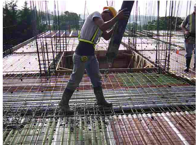
Colocación de mallas, armaduras y dados chorrea de losa con bomba

Una vez correado el entrepiso, se arman las columnas del piso donde se ubicará el salón de encamados y la sala de procedimientos, se realiza la mampostería de muros de corte y carga y sobre ellos se monta la armadura de las vigas coronas.