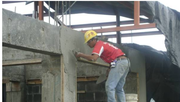
Chorrea de columnas y repellos