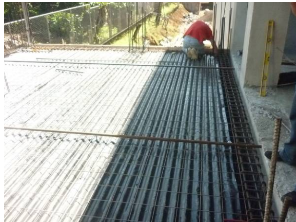
soporte de zinc sobre entrepiso