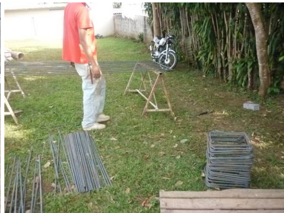
Armadura de cimientos y columnas