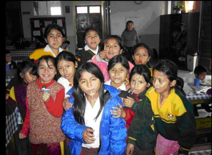
NIÑOS EN EL COMEDOR