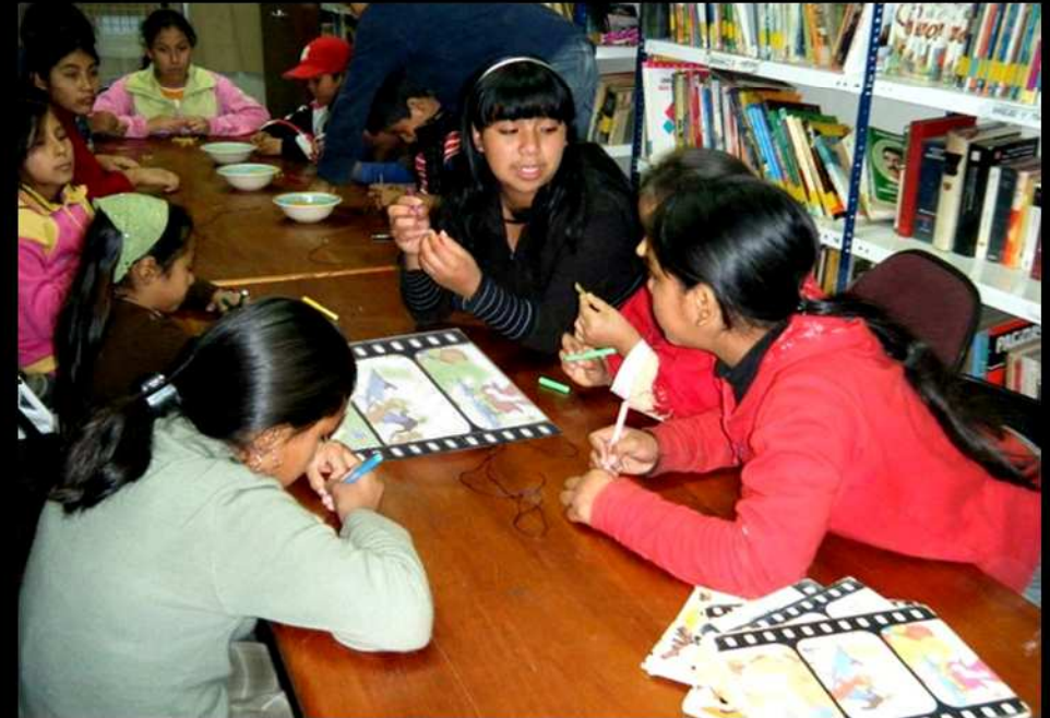
UNA DE LAS BIBLIOTECAS DE LOS COMEDORES POPULARES.

Estas bibliotecas hacen del complejo del comedor popular una instalación completa para la mejor formación de los niños tanto física como intelectualmente.