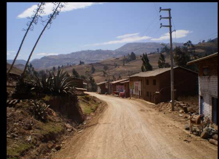
OTUZCO ES AMBIENTE RURAL EN LA SIERRA PERUANA