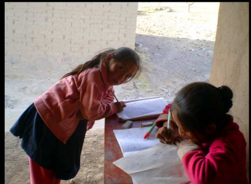
DOS NIÑAS EN UN CASERIO DE OTUZCO HACIENDO LOS DEBERES

Por esto AS a promovido una campaña de material escolar para que se disponga de él en las escuelas de la zona. Haciendo así la educación más efectiva.