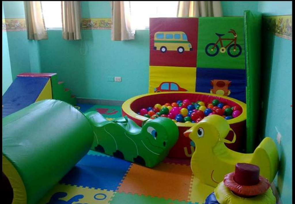
LA SALA DE ESTIMULACIÓN TEMPRANA DE SANTA ANITA, LIMA

Este proyecto, a modo de ludoteca permite que estos niños mejoren sus capacidades físicas y mentales en un ambiente saludable y de calidad.