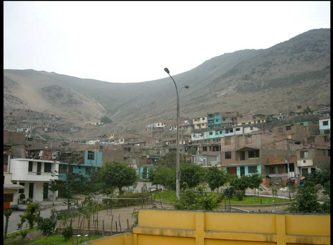
PANORÁMICA DE SANTA ANITA EN LIMA.

Una recomendación MUY IMPORTANTE, nunca aceptes paquetes, chaquetas, etc., de una persona extraña y especialmente no transportes las cosas de otra persona, sin importarte si parecen muy amables, siempre ten cuidado en ese sentido, ya que en Perú existe producción de Clorhidrato de Cocaína y podrías ser víctima de esta red sin darte cuenta.