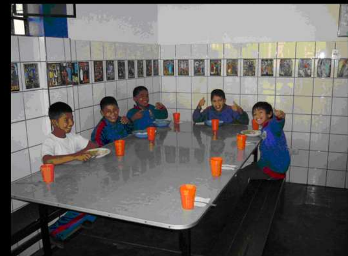
UNA DE LAS MESAS DEL COMEDOR