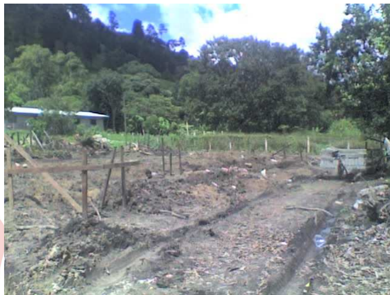
Fotografía 1. Inicio de las obras

En octubre de 2007 se inicio la cotización de la mano de obra calificada, con la finalidad de iniciar la construcción en el momento en el que se recibiera la financiación complementaria que se nos había aprobado.