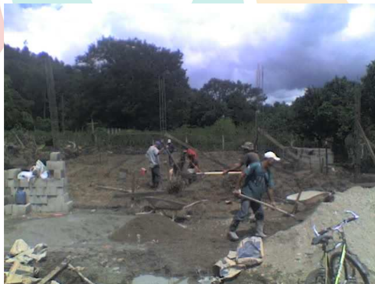
Fotografía 2. Durante las obras

El cimiento se hizo, como se dijo anteriormente, con una zapata corrida. Esto da mucha seguridad a toda la construcción.