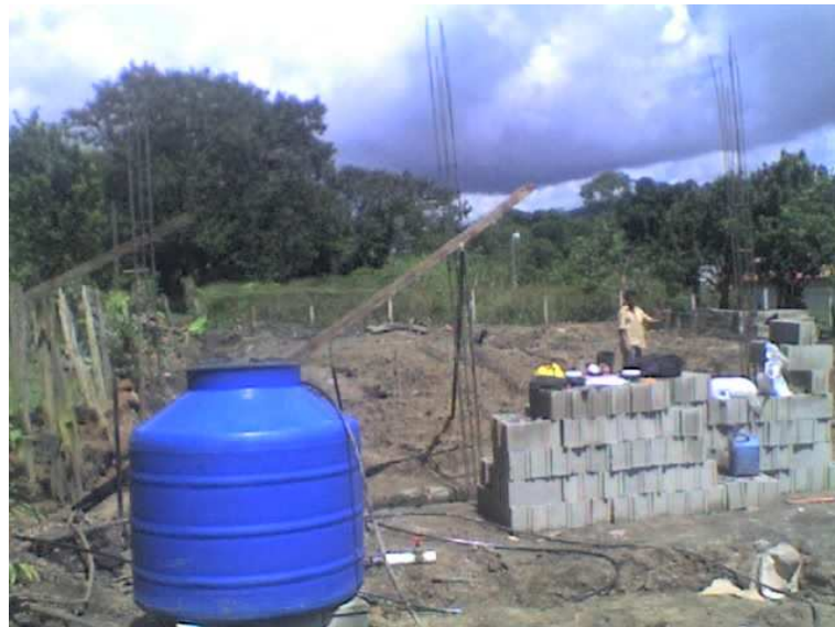
Fotografía 3. Levantamiento de las paredes