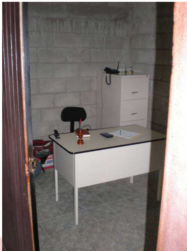
5. Sala de reuniones y almacenaje