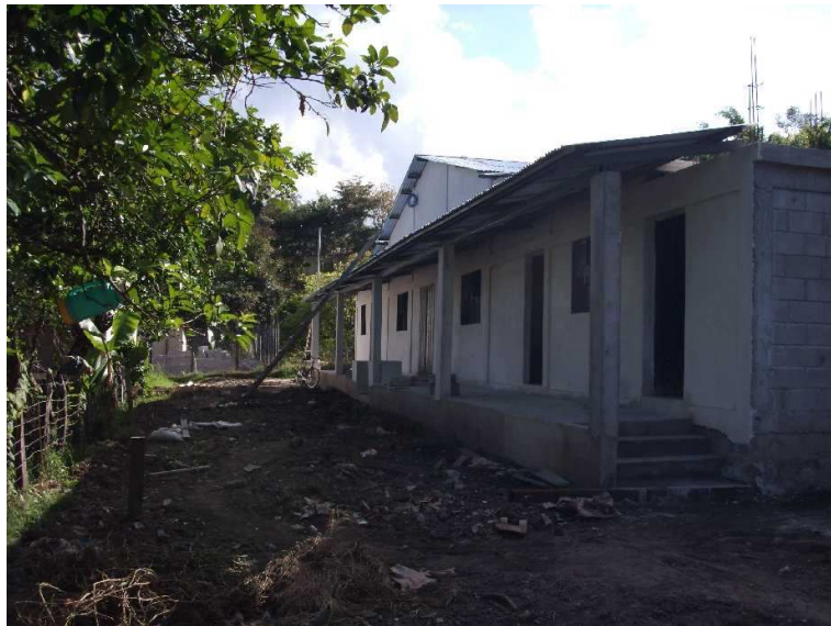
Fotografía 4 Edificio terminado